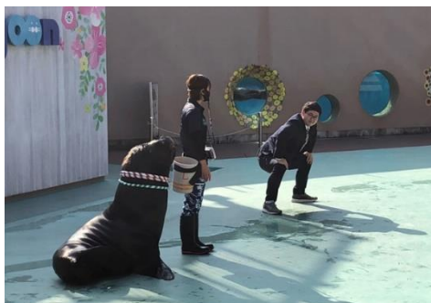
帆貴先生も大活躍、八景島シーパラダイス