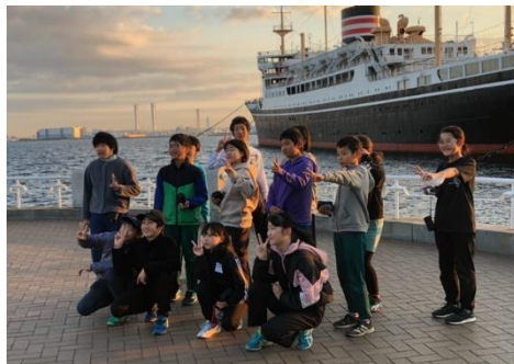
朝日の中の横浜山下公園と氷川丸