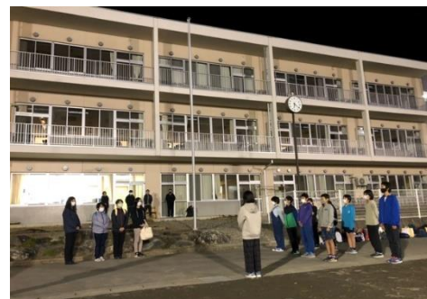
6年生の言葉に感動した解散式