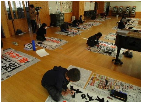
書き初め大会(高学年)

1月7日(金)、校内書き初め大会が行われました。1、2年生は硬筆で、3～6年生は毛筆で、ゆっくりと大きく、そして丁寧に丁寧に書き進めました。一人一人の書く姿や文字を見て