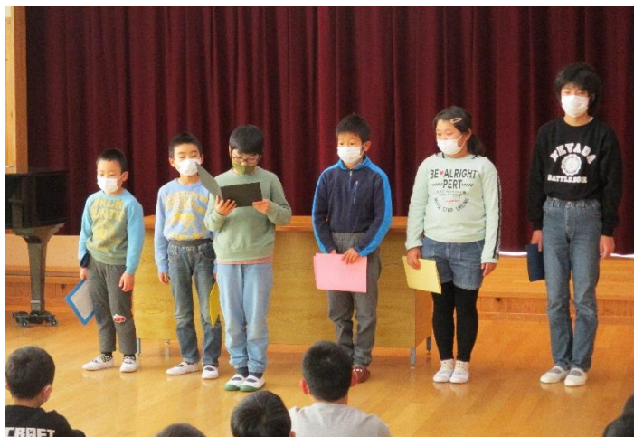
学年代表による「誓いの言葉」の発表

3学期初日、始業式は、各学年の代表者による「誓いの言葉」の発表から始まりました。「算数を頑張る、計算と漢字を頑張る、書き初めを頑張る、授業を頑張る、チャレンジしていけるように頑張る」など、どの子からも決意が伝わってくる良い発表でした。上野小学校は全校の人数が少ないため、代表としてみんなの前に立って話す機会が、全ての子に何度も回ってきます。話すだけではなく、学年の仲間と協