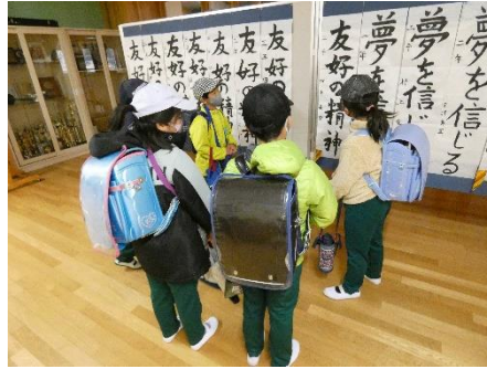
廊下に飾られた中学生の作品

いて、「気持ちを込める」というのは、こういうことなのだと思います。すばらしい姿でした。今、廊下には、中学生の作品も飾られ、それを見て、子どもたちが「すごく上手!」と話しています。